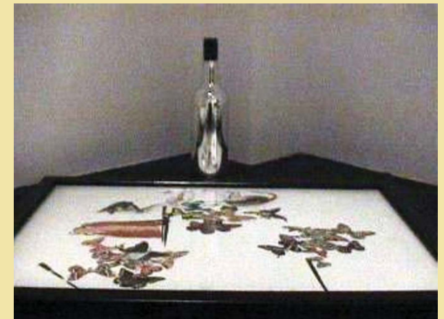
El caballero de las mariposas