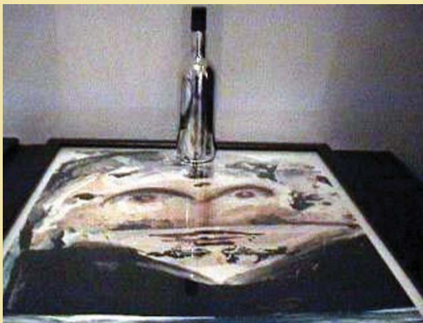
Desnudo femenino, 1972